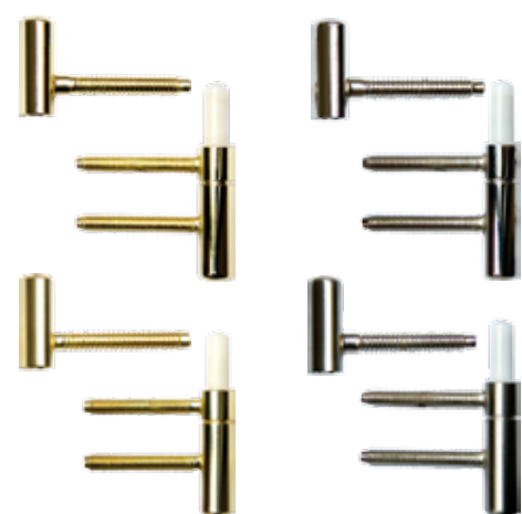
Balamale "PRIME" disponibile în culorile: auriu, auriu mat, argintiu, argintiu mat.