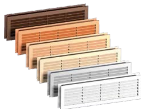
Grilă de ventilație (diferite culori)