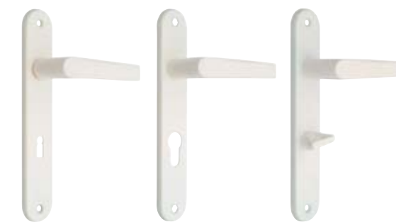
standard pregătire cilindru cu buton baie