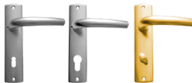
standard pregătire cilindru cu buton