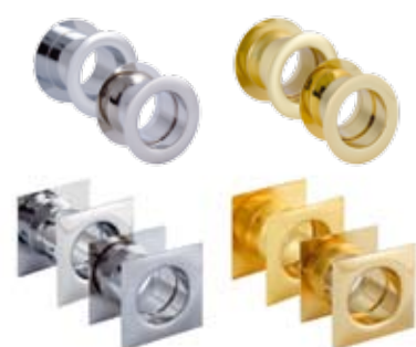
Inele pentru orificiile de ventilație comercializate individual. Culori: auriu, auriu mat, argintiu, argintiu mat