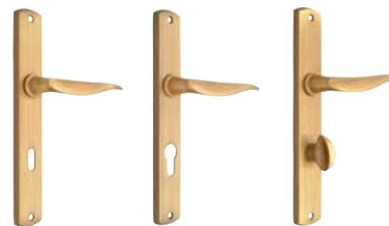
standard pregătire cilindru cu buton