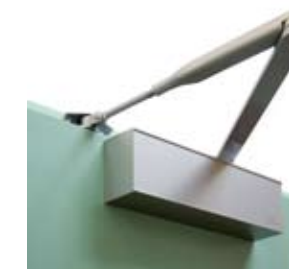
Dispozitiv de autoînchidere Culori disponibile: argintiu sau maro