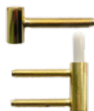
Balamale comercializate individual. Cost suplimentar pentru a treia balamală, pentru toc și foaia de ușă