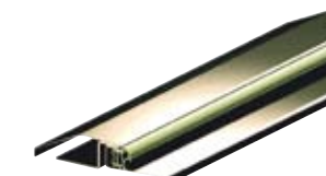
Prag de inox pentru tocuri de uși Porta: standard (90 mm) extins (120 mm)