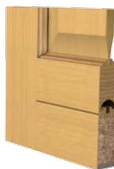
Canelura pentru ventilație la uși furnizite.