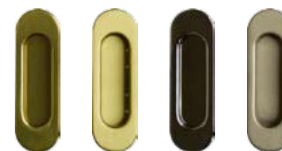
Mâner lateral pentru uși glisante: culori: auriu, auriu mat, argintiu, argintiu mat.