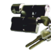
Doi cilindri clasa "B" antifurt: argintiu, auriu