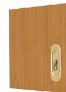
Broască specială cu mâner lateral și frontal, pentru uși glisante, culoare auriu, auriu mat, argintiu, argintiu mat.