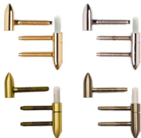
Balamale Porta comercializate individual. disponibile în culorile: auriu, auriu mat, argintiu, argintiu mat.