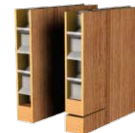
Pregătirea pentru scurtarea canatului