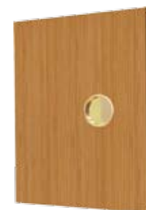
Mâner pentru uși glisante incluse în prețul canatului. Culoare argintiu (pentru uși albe) și auriu (pentru uși culoarea lemnului).