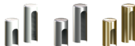
Capace de balamale pentru uși de interior (set pentru 1 buc) culori: alb, argintiu mat, crom, auriu